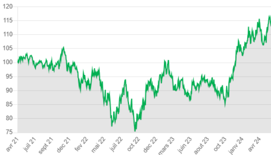
Performances mensuelles historiques du Certificat (% , nettes de frais):